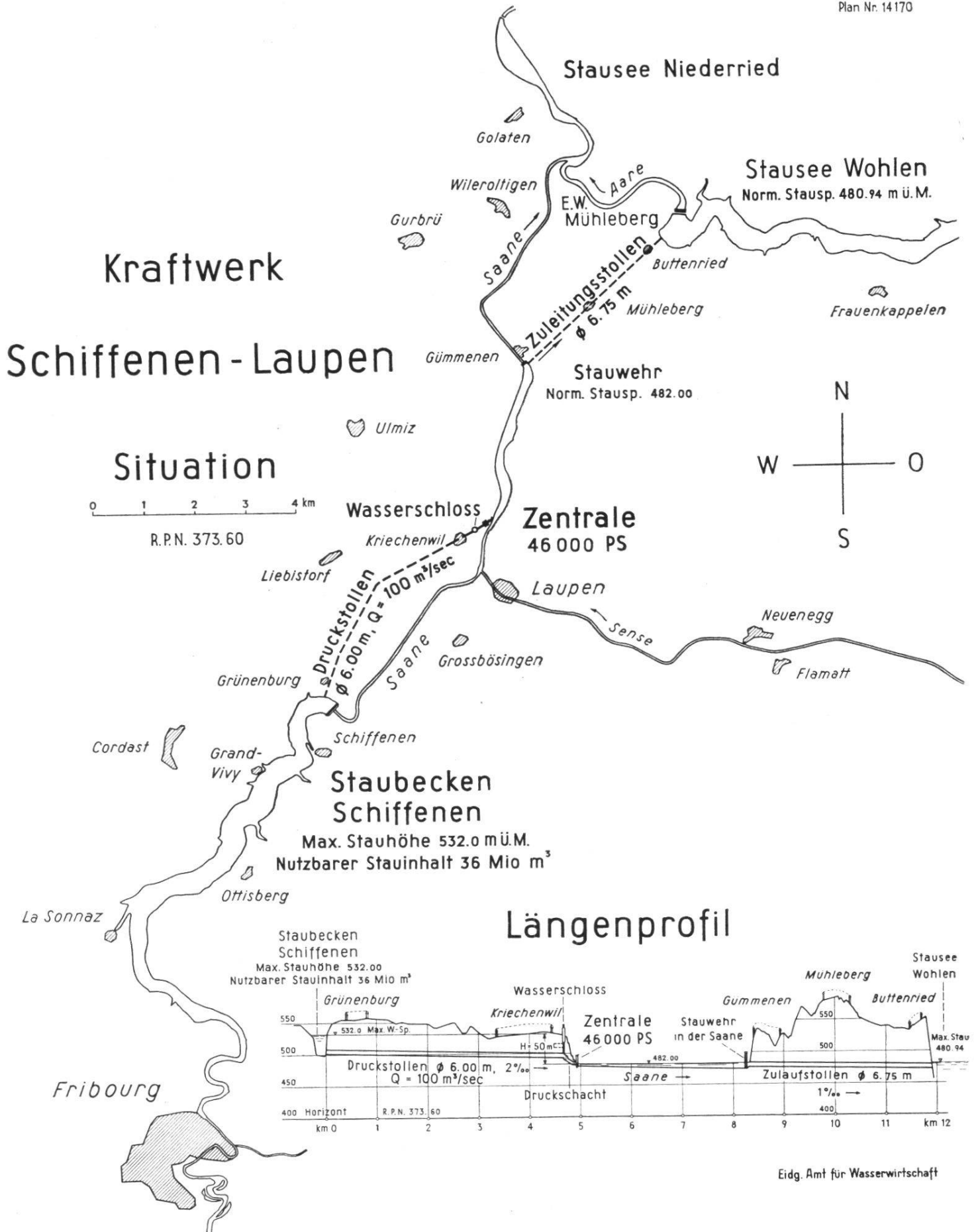
Fig. 16. Avant-projet d'usine Schiffenen-Laupen. Situation et profil en long.