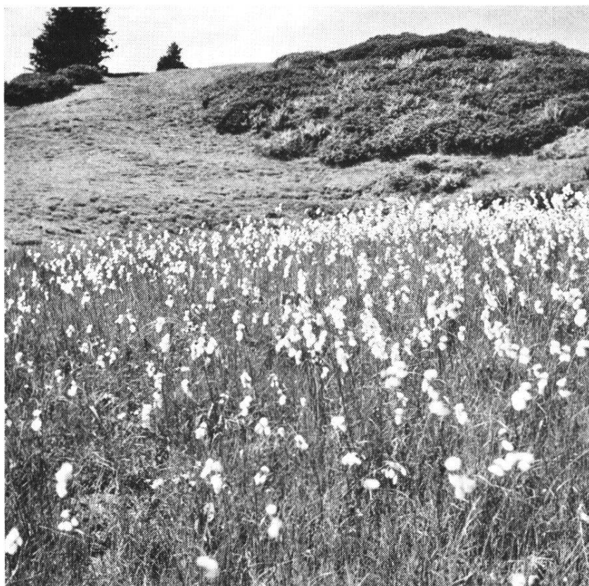
Fig. 3 Caricetum davalliana (Cousimbert)

Le tableau montre clairement la variabilité de l'association qui se subdivise en trois sous-associations et un facies à Equisetum palustre exprimant des conditions écologiques différentes.