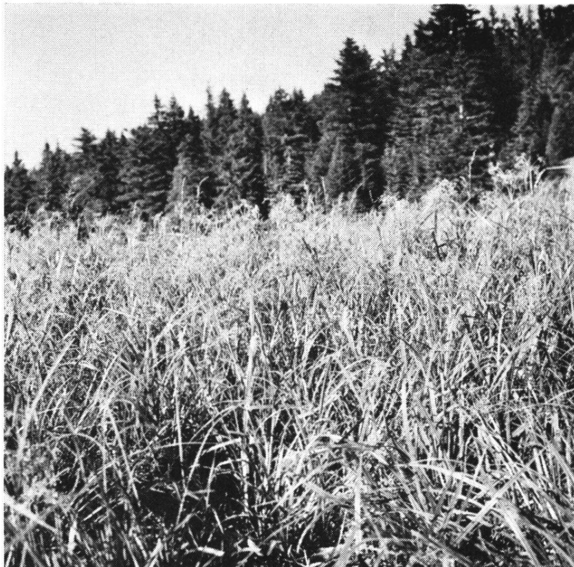
Fig. 2 Cardamino-Scirpetum (Le Niremont)

Scirpus silvaticus se développe avec une telle vigueur qu'il atteint jusqu'à 1 m. 20 de hauteur. Il couvre entièrement le sol, les espèces satellites formant une strate inférieure. Cette caractéristique ne se rencontre jamais dans d'autres groupements avec une telle vitalité. On la rencontre aussi éparsé aux bords des ruisseaux, dans les dépressions, mais toujours à l'état stérile.