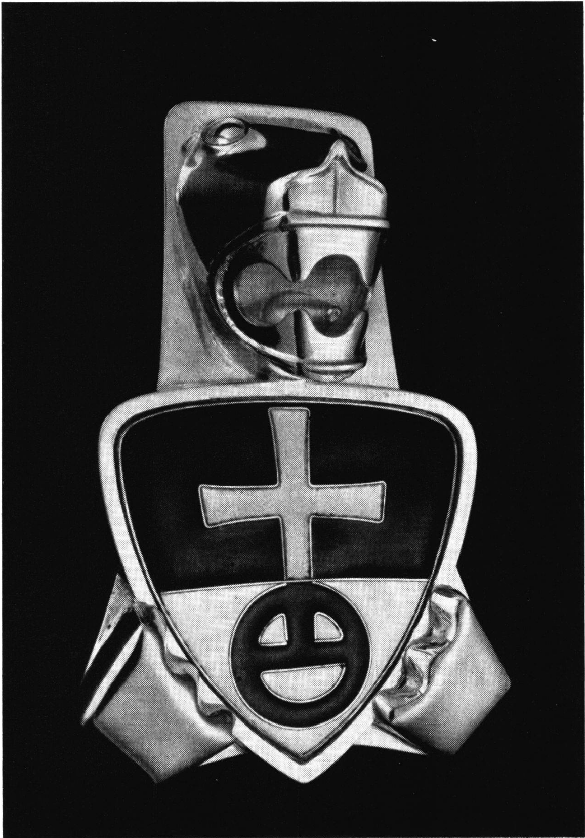
Weibelschild der Universität