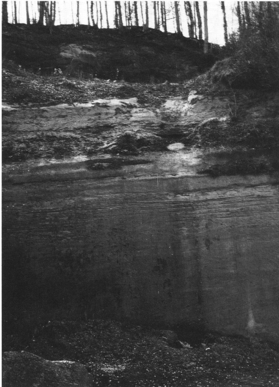
Fig. 1: La carrière de Villarlod en 1995 (partie non exploitée en ce moment, montrant la partie supérieure plus litée).

Plus récemment, l'une de ces carrières est décrite en 1960 par INGLIN, qui en donne les coordonnées précises (567°54/172°80) et note que son «front de taille, haut de 17 à 18 m, présente sur 12 m un grès moyen gris-verdâtre