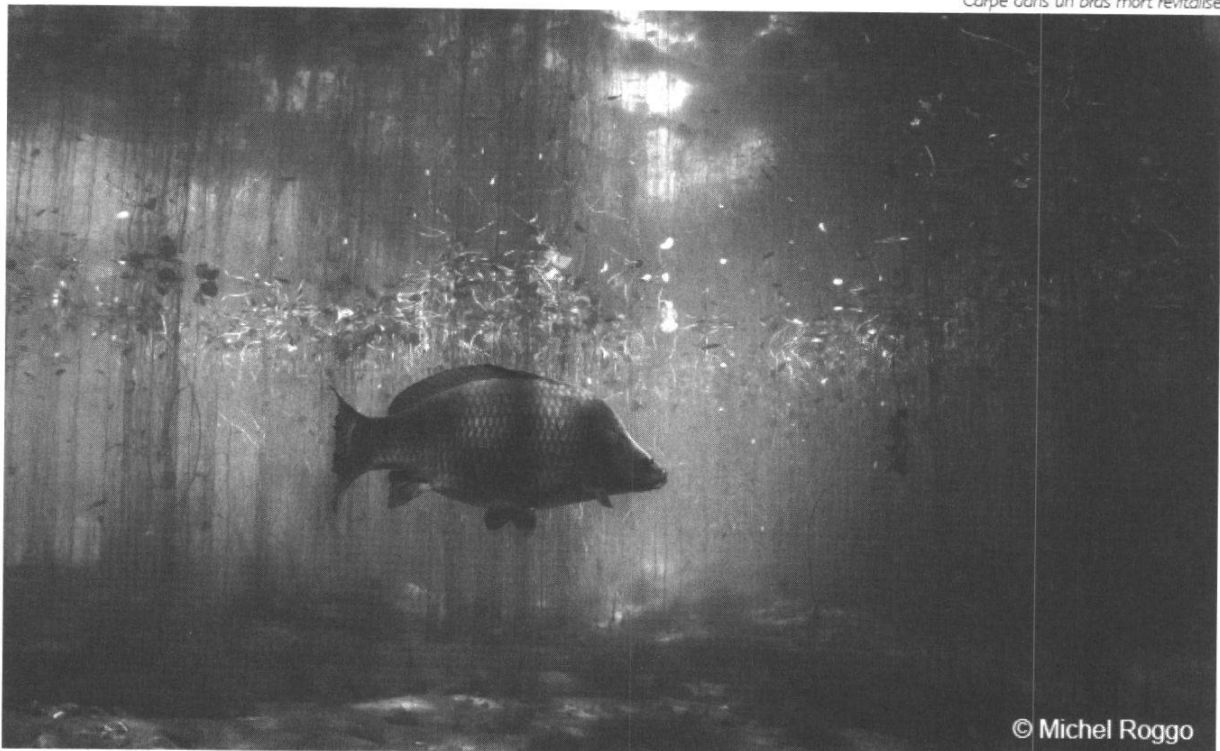
Carpe dans un bras mort revitalisé