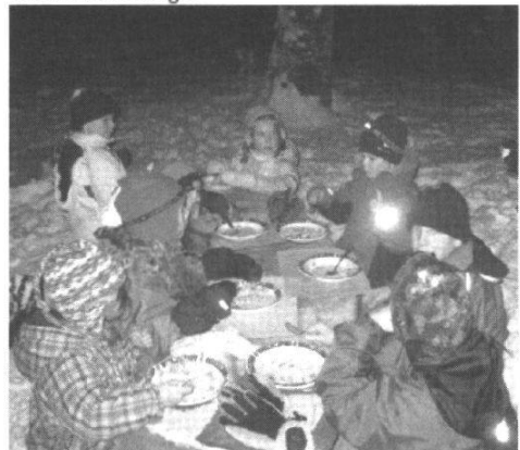
© Catherine Pfister, groupe Jeunes + Nature