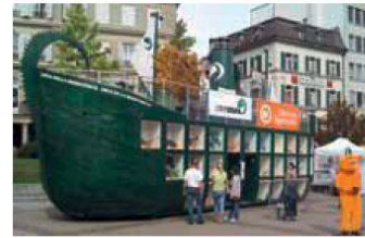
Arche de la biodiversité de Pro Natura

tura a transformé une surface dévolue à la voiture en un jardin citoyen. L'Arche de la biodiversité a quant à elle jeté l'ancre sur la Place Python du samedi au jeudi. Petits et grands, familles et classes ont eu ainsi l'occasion de visiter l'exposition dédiée à la perte de la biodiversité et aux causes de cette évolution.