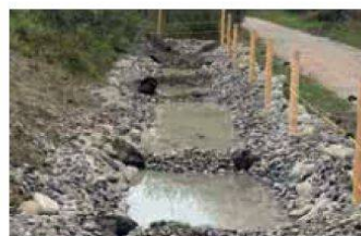
Nursery idéale pour les sonneurs