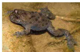
Sonneurs à ventre jaune

rencontrer au pied du barrage de Schiffenen, n'ayant plus été observés dans la réserve depuis quelques années, nous espérons qu'ils recoloniseront les lieux assez rapidement.