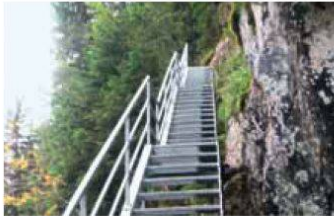
Un sentier pédestre discutable

L'itinéraire "Höhenweg" autour du Lac Noir a été conçu afin d'offrir une alternative supplémentaire aux randonneurs. Intégrant dans la plupart des cas des sentiers déjà existants, ce parcours a nécessité un aménagement ad hoc entre la Brecca et les Recardets, dans une zone difficile d'accès et d'estivage des chamois. Ces travaux ont été mis à l'enquête à posteriori, sur dénonciation de Pro Natura. Cette année, une autorisation spéciale a été délivrée par le canton pour construction hors zone à bâtir, légalisant ainsi l'aménagement. Pro Natura, estimant que les conditions d'une telle autorisation ne sont pas réunies, a recouru auprès du Tribunal cantonal.