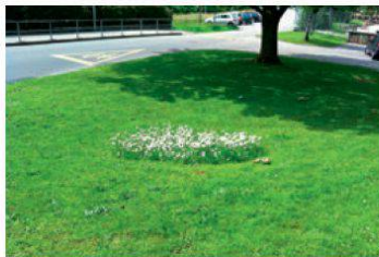
Nature en ville: on pourrait mieux faire!