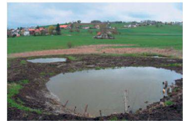
Bergmoos à Schmitten

et leur volonté de mettre à disposition des terrains, initialement des surfaces humides, pour la création de zones à batraciens. Pro Natura s'est occupée de la coordination des travaux, de la recherche de fonds et du maintien à long terme de ces zones revitalisées en signant des contrats de servitude avec les propriétaires. Ces travaux s'inscrivent dans un projet plus large de mise en réseau des surfaces humides autour de la réserve de l'Auried.