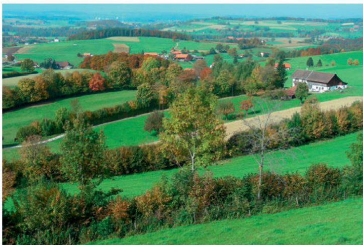
Un des thèmes de l'exposition: paysage agricole structuré pour plus de biodiversité

Les délégués de l'association nationale se sont réunis les 25 et 26 août à Fribourg sur invitation de la section. Au menu