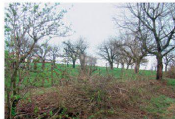
Vergers de Lovens avec haie et tas de branches

Propriété de Pro Natura depuis 2007, le terrain, essentiellement voué aux arbres hautes-tiges, comporte également une haie d'une trentaine de mètres. Composée surtout de noisetiers, elle a été revitalisée ce printemps par la plantation de buissons de diverses espèces (épine noire, fusain, viorne lantane, églantier, cornouiller, troène, chèvrefeuille des haies).