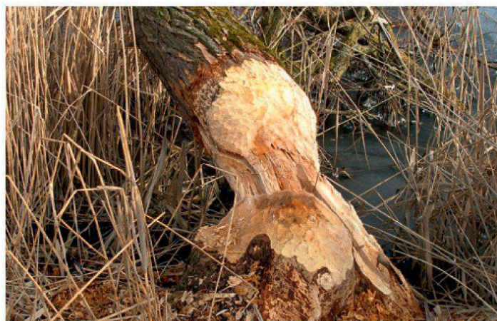
Le castor est à l'oeuvre à Seedorf

Loin des clichés de grands espaces et de nature vierge souvent associés à cette espèce, le réalisateur nous offre une belle histoire, authentique et résolument positive, avec des images inédites et d'une grande beauté prises sous l'eau.