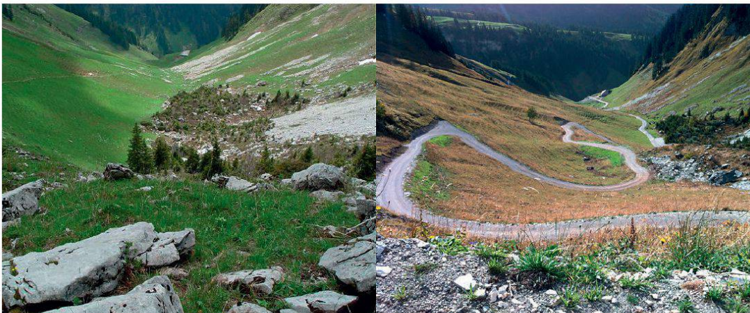
Vallon de Chueboden avant... après

C'est par un froid glacial, au lac de Pérolles, que la saison a commencé en février. Les enfants ont pu y découvrir les mœurs des oiseaux hivernants. En mars, ils ont créé des hôtels à insectes et se sont rendus en avril à l'Auried pour chanter avec les rainettes. Malheureusement, en mai, la reconnaissance des plantes et la fabrication d'un herbier n'ont pas inspiré les petits naturalistes et la sortie a été annulée. Ils se sont rattrapés en juin en parcourant Fribourg et ses environs en suivant les traces des glaciers. L'animal de l'année était à l'honneur en septembre avec l'excursion "fascination chauves-souris". En octobre, la saison s'est clôturée par une initiation à la spéléologie. Merci aux enfants et aux moniteurs pour ces magnifiques moments de découverte et d'échange.