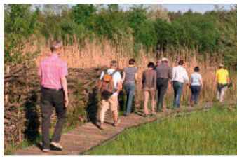
Excursion du cinquantenaire

Cette année encore, les excursions ont rencontré un franc succès. 50 classes ont bénéficié d'une excursion guidée. Au printemps, un animateur était également sur place pour répondre aux questions des visiteurs, ceci durant treize journées. La réserve a aussi accueilli les participants à cinq excursions organisées dans le cadre du cinquantenaire de la section. Les journées d'entretien, deux jours au printemps et deux autres en automne, ont été comme d'habitude très bien fréquentées. Au programme: entretien du sentier, taille de buissons, nettoyage d'étangs et fauche des surfaces à litière. Merci à tous les bénévoles qui s'engagent en faveur de la préservation de ce site important pour les batraciens et fort apprécié des oiseaux nicheurs et migrateurs.