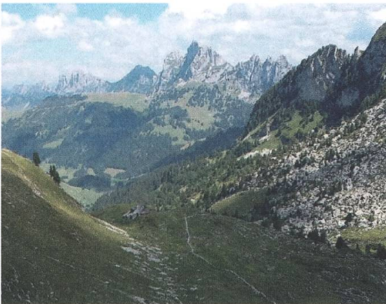
Vallon des Morteys

Anja Glücklich aus Hamburg hat im Sommer 2017 einen Film über das Schutzgebiet gedreht. Darin kommen mehrere Personen zu Wort: ein Wildhüter, ein Botaniker, Bergführer, Höhlenforscher und der Verantwortliche von Pro Natura. Das Ziel war es, den ZuschauerInnen den unermesslichen natürlichen Reichtum dieses Ortes vor Augen zu führen. Der Film wurde am 30. Oktober 2017 auf 3sat ausgestrahlt und soll zu einem späteren Zeitpunkt auch auf SRF gezeigt werden.