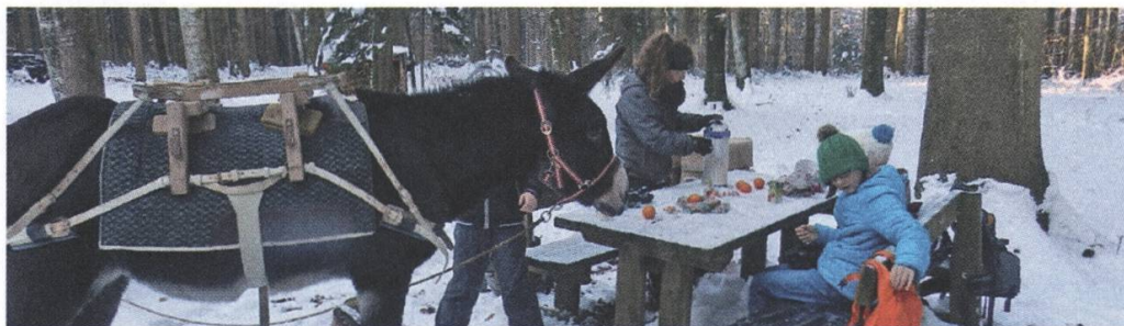
Eine redlich verdiente Zvieripause für alle Teilnehmenden während der im Dezember organisierten Schnitzeljagd

Nebst einem überdimensionierten Brettspiel der Jugendnaturschutzgruppe zur Biodiversität in Naturgärten wurde das Publikum auf das brandaktuelle Thema der übermässigen Verwendung von synthetischen Pestiziden sensibilisiert. Diese Problematik betrifft sowohl die Landwirtschaft als auch das private Umfeld. Pestizide verursachen erhebliche Umweltverschmutzungen, über deren genauen und langfristigen Auswirkungen auf die Lebewesen noch sehr wenig bekannt ist. Die Sektion hat überdies zahlreiche Unterschriften gesammelt, um zwei Initiativen zugunsten einer strengeren Reglementierung von synthetischen Pestiziden zu unterstützen.