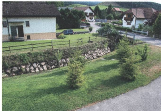
Vorher-/Nachher-Fotos der abrazierten Hecke in St.Silvester im Juni 2017