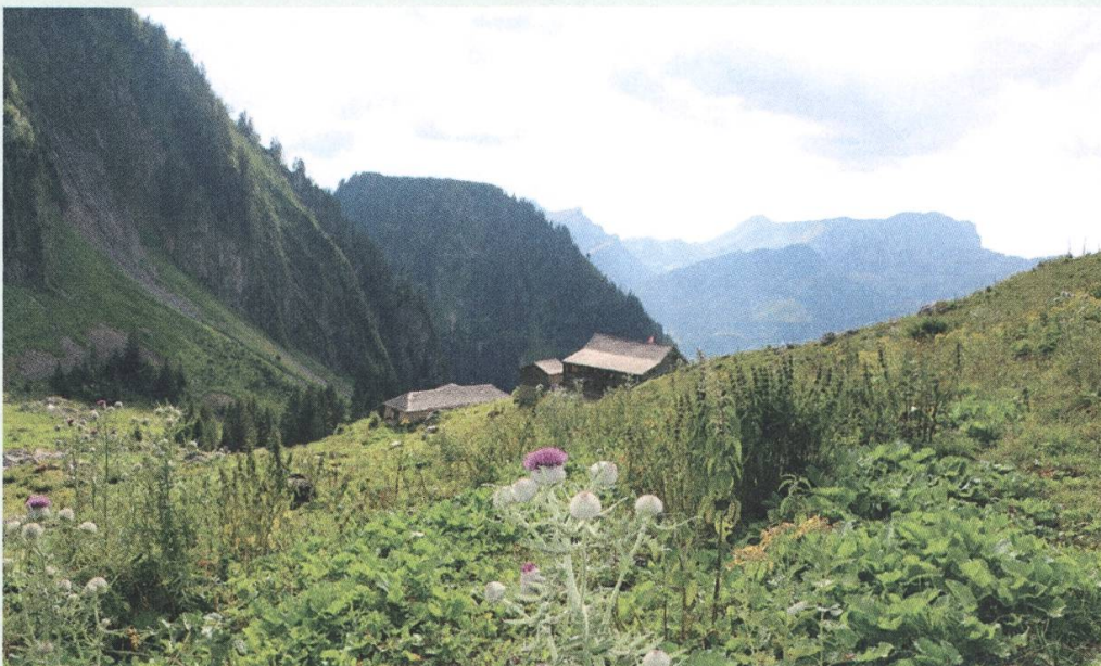
Vallon de Bounavaux

Nach der Diskussion innerhalb der Kommission stimmten die Mitglieder für eine Aufrechterhaltung der Gämsejagd in Bounavaux. Dazu ist anzumerken, dass die Vertreter der Naturschutzkreise in der Kommission bei weitem in der Minderheit sind. Der endgültige Entscheid oblag dem Staatsrat, welcher der Meinung der Kommission Folge leisten kann oder nicht. Der Staatsrat hat beschlossen, die Jagd in Bounavaux weiterhin zu erlauben!