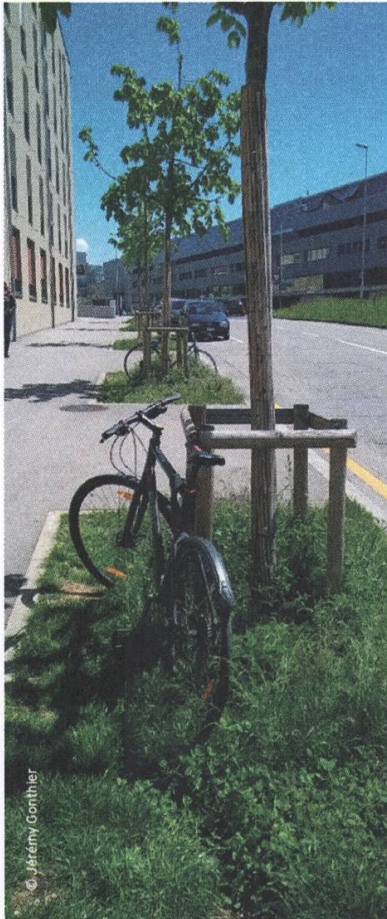
Beispiel einer analysierten Grünfläche im Pérolles-Quartier