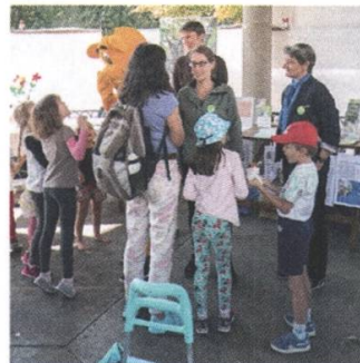
Dank der Unterstützung von freiwilligen HelferInnen konnte Pro Natura Freiburg den ganzen Tag über viele BesucherInnen willkommen heissen.

Der Stand von Pro Natura Freiburg am Biomarkt Freiburg war gut besucht. Jung und Alt konnten sich über Pestizide informieren lassen, das Thema dieser 7. Ausgabe des Biomarktes, aber auch einer laufenden Kampagne von Pro Natura mit dem Titel "Keine Pestizide in unseren Gewässern!".