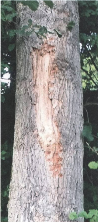
Geschädigter Baum an der an der Strasse zwischen Nesslerer und Gomma im Sommer 2017

Auf dem Programm der Stadt Freiburg war 2016-2017 die Beseitigung von rund fünfzig Bäumen aus Sicherheitsgründen vorgesehen. Glücklicherweise wurde in der Presse eine Information verbreitet, denn die Stadt hatte es versäumt, das Gesuch für die Baumfällungen öffentlich aufzulegen. Nach der Prüfung des Dossiers haben wir interveniert, um eine Verbesserung der Kompensationsmassnahmen zu erreichen, insbesondere in Bezug auf die Auswahl der Baumarten und den Erhalt von toten Bäumen als Lebensraum sowie um auf das mögliche Vorhandensein von Fledermäusen aufmerksam zu machen, welche in den Baumhöhlen überwintern.