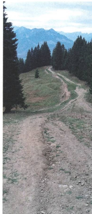
Mountainbike-Piste auf der Berra entlang einer landwirtschaftlichen Erschliessung

Diese Änderung betraf die Wintersport- und Freizeitzone. Unsere Einsprache konzentrierte sich auf verschiedene Bereiche, jedoch insbesondere auf die Entwicklung von Mountainbike-Pisten, namentlich im Wald von La Joux, ein noch weitgehend naturnaher Wald und ein schützenswertes Biotop. Wir konnten uns schliesslich mit den Gesuchstellern einigen: Der Verlauf der Mountainbike-Piste wird geändert, im Wald von La Joux wird eine 50 ha grosse Altholzzone geschaffen und der Schneeschuh-Pfad wird ausserhalb des erwähnten Waldes verlegt