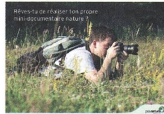
Flyer des Projekts Camera Nature