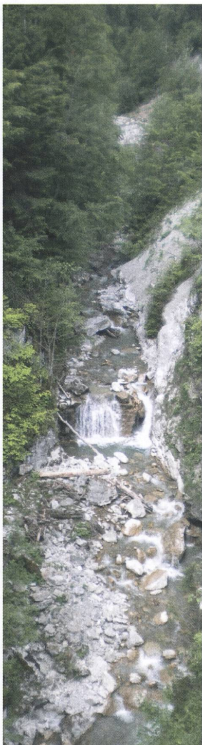
Der vom Wasserkraftprojekt betroffene Abschnitt des Marive in der Evi-Schlucht

Der Marive ist ein Bergbach mit natürlicher Dynamik, der am Fusse des Dent-de-Lys entspringt. Er fliesst durch die Evi-Schlucht, wo Greenwatt ein Mikro-Wasserkraftwerk bauen will. Im Zuge dieses Projekts, gegen das wir im Oktober 2017 Einspruch erhoben haben, wäre die Restwassermenge mindestens achtmal niedriger als die durchschnittliche Abflussmenge. Dies würde insbesondere