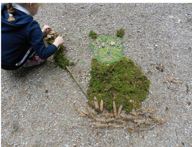
Activité landart proposée lors du rallye sur le chat sauvage

A travers son projet Biodiversité en milieu bâti, Pro Natura Fribourg s'investit pour améliorer la biodiversité en milieu urbain en proposant, durant 5 ans, des valorisations d'espaces verts en Ville de Fribourg et dans son agglomération. En 2020, c'est dans le quartier de Pérolles que le projet a pris place. Un appauvrissement du sol, un semis de prairie, des plantations d'arbustes et une mise en place de troncs ont été effectués sur une terrasse du parc du Domino, en Ville de Fribourg.