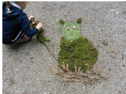
Landart-Aktivität während der Wildkatzen-Rallye

Am 13. September 2020 organisierte Pro Natura Freiburg im Rahmen der Europäischen Tage des Denkmals zwei kostenlose Führungen für die breite Öffentlichkeit. Die Teilnehmer und Teilnehmerinnen konnten sich in Rohr bei Tafers im Sensebezirk sowie in Progens im Vivisbachbezirk mit den Hecken und dabei insbesondere deren strukturellen, ökologischen und landschaftlichen Funktionen vertraut machen. Diese von Biologen und Historikern geleiteten Besuche zogen über 60 Interessierte an, die sich näher über dieses wichtige Gemeingut informieren wollten.