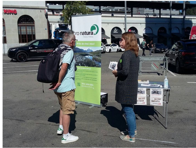
Sensibilisation de la population aux enjeux de la votation sur la loi sur la chasse

Le 27 septembre 2020, les citoyennes et citoyens suisses ont refusé par 51.9% une révision de la loi sur la chasse s'apparentant à un véritable démantèlement de la protection de la nature. Dans le canton de Fribourg, cette révision a été acceptée du bout des lèvres à 50.7%, ce qui est un excellent résultat étant donnée la configuration sociopolitique du canton largement dominée par les milieux traditionnellement partisans de cette révision! Pro Natura Fribourg, WWF Fribourg et surtout le comité cantonal du « NON à la loi sur la chasse » ont mené une campagne engagée. Merci pour votre soutien !