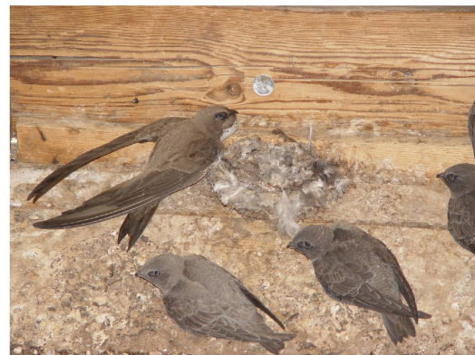
Martinets à ventre blanc et leurs jeunes au nid

Pro Natura et les autres organisations fribourgeoises de protection de la nature, du paysage et du patrimoine se sont associées pour former l'EcoForum. Ensemble, nous avons rédigé un manifeste à l'intention des instances politiques. Celui-ci se compose de 13 mesures urgentes dans les domaines de la protection de la nature, de l'environnement, du paysage et du patrimoine bâti, dont nous demandons la réalisation d'ici la fin de la prochaine législature (2026). Le