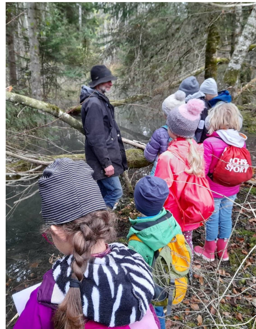
Beobachtung von Spuren des Bibers anlässlich der Kinderexkursion im November in Plaffeien

Auch in diesem Jahr bot Pro Natura Freiburg Nature à la Carte an. Dieses pädagogische Angebot fand von April bis September statt und richtete sich an Schüler im Alter von acht bis zwölf Jahren. Nature à la Carte bietet Schulklassen die Möglichkeit, in die Welt der Fledermäuse und Amphibien einzutauchen. Im Jahr 2021 nahmen 90 Schüler an diesen Exkursionen teil. Sie fanden in der Nähe der jeweiligen Schule statt und wurden von Fachpersonen geleitet. Ein Hinweis an Lehrpersonen: Das Angebot, das 2022 fortgesetzt und in Partnerschaft mit dem Programm Kultur & Schule des Kantons Freiburg realisiert wird, kann direkt über das Pädagogische Portal Kanton Freiburg, Friportail, gebucht werden.