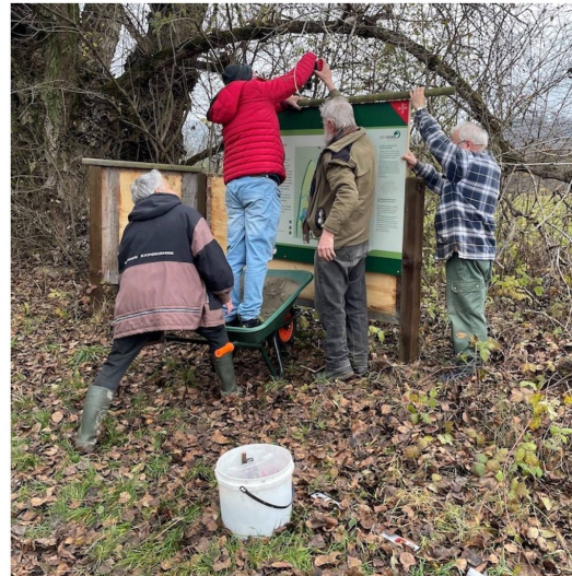
Installation einer neuen Informations-tafel im Naturschutzgebiet Auried