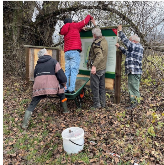
Pose de l'un des nouveaux panneaux d'information dans la réserve naturelle de l'Auried