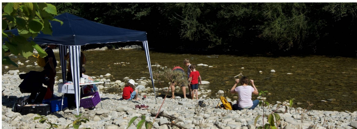
Participants à la journée sur le Gammare à Marly