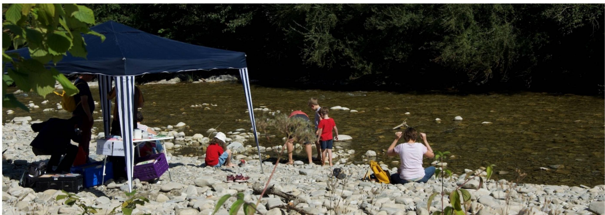
Teilnehmende an der Veranstaltung „Tag des Bachflohkrebs“ in Marly