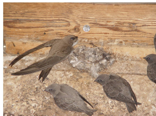
Alpensegler mit ihren Jungen im Nest

Pro Natura und die anderen Freiburger Organisationen für Natur-, Landschafts- und Heimatschutz haben sich zum EcoForum zusammengeschlossen. Gemeinsam haben wir ein Manifest an die Adresse der politischen Instanzen verfasst. Dieses besteht aus 13 dringlichen Maßnahmen in den Bereichen Natur-, Umwelt-, Landschafts- und Heimatschutz, deren Umsetzung wir bis zum Ende der nächsten Legislaturperiode (2026) fordern. Der Kanton ist zu jeder dieser 13 Maßnahmen gesetzlich verpflichtet, hat aber die ihm gesetzten Fristen nicht eingehalten. Dies oftmals aufgrund fehlender finanzieller und per-