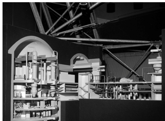
ANHANG 4.2 – Modell des Reaktors der CNEC.