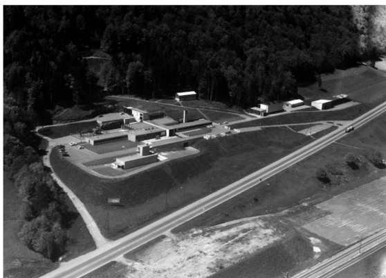
ANHANG 4.1 – Der Standort (Außenanlagen) der CNEC an der Kantonsstrasse von Lucens/VD nach Moudon/VD.