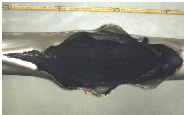
ANHANG 4.4 – Geborstenes Brennelement des Reaktors der CNEC.