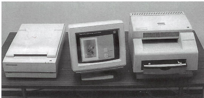
Die Kodak Digital Print Station (DPS) besteht aus drei Komponenten (v.l.n.r.): einem Flachbettscanner, einem 13-Zoll-Touchscreen-Monitor und einem digitalen Thermo-Sublimations-Farbdrucker. Sie ist modular aufgebaut und deshalb sehr platzsparend.

Kodak hat die Digital Print Station bereits europaweit in umfangreichen Feldtests getestet. In der Schweiz wurden sechsmonatige Tests bei 20 Verkaufspunkten in 15 Städten durchgeführt. Die Ergebnisse zeigen eine sehr hohe Akzeptanz bei den Kunden. Zum Beispiel wurden die Kriterien Fotoqualität, Farben, Geschwindigkeit, Handhabung und Möglichkeiten der Digital Print Station allesamt mit Noten zwischen 8,57 und 9,09 bewertet (10 = Maximum). 92% der Endkonsum-