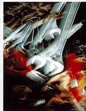
Gewinnerbild von Reto Schubnell 1. Preis, Kategorie Fotolaboranten Beste Vergrösserung ab Format 4x5"