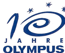
Foto Professional '95 Die Renaissance des OM-Systems