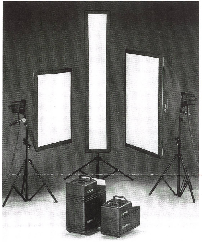
Multiblitz Magnolite für die perfekte Studioausrüstung

penköpfen und Systemteilen aufgabenspezifisch bestückt werden. Dazu gehört ein breites Zubehörangebot für die höchsten Ansprüche kreativer Berufsfotografen.