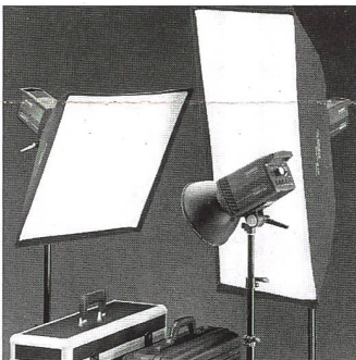
Multiblitz Profilite 200 und 400

PROFILITE COMPACT ist unter Berufsfotografen seit Jahren