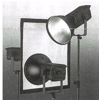
Multiblitz Variolite Compact

Tausendfach bewährt für den Fotografen «on location» sind die leichten, aber leistungsstarken Multiblitz Variolite Compact, die in den bewährten Leistungsvarianten 300, 600, 900, 1200 und 1800 Ws verfügbar sind. Mit ihrem breiten und voll kompatiblen Zubehörsortiment – mit verschiedenen Reflektoren, Vorsätzen, Lichtboxen und Stativen – sind sie im Studio für Porträt-, Gruppen- und Sachaufnahmen ebenso für eine effektvolle Lichtführung geeignet wie bei Aufnahmen beim Kunden oder sogar im Freien.