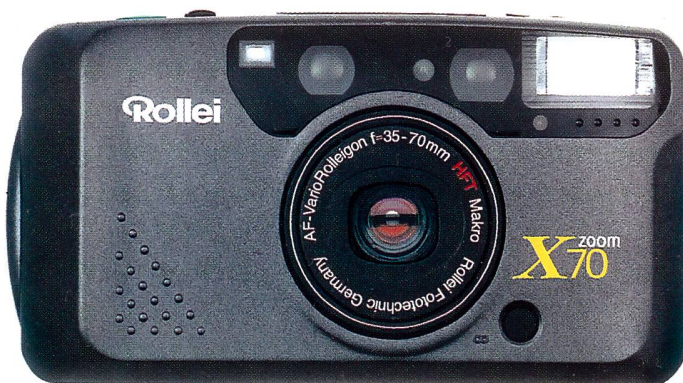
Mit dem neuen Erfolgsmodell Zoom 70X liegt die Marke Rollei in einem attraktiven Preissortiment und bietet viel Automatikkomfort.

und ist mit dem mehrschichtvergüteten Rollei HFT 35-70-mm-Zoom auf kreatives Fotografieren ausgelegt. Das aktive Infrarot-Autofokus-System besitzt 256 Stufen und einen Schärfespeicher. Mit der Makrostellung bis 0,5 cm, der Schnappschuss-Einstellung für den Entfernungsbereich 1,3 bis 5 m und der Unendlich-Position ist die Rollei Zoom X70 technisch gut ausgerüstet. Zudem bietet sie Porträtfunktion mit automatischer Bildausschnitt-Einstellung. Dazu: «Fuzzy-Logic», Blitzautomatik, Vorblitz, Serien- und Intervallaufnahmen sowie Mehrfachbelichtungen. Die gewählten Funktionen werden auf einem übersichtlichen LCD-Display angezeigt.