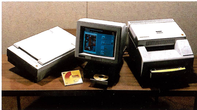
Digitale Bildbearbeitungssysteme – wie hier das Kodak Digital Print System – sind je länger je mehr auch für den Fotofachhandel interessant, weil der Kunde die Bildkompetenz im Fotofachgeschäft sucht.

Bild gedruckt werden, so hat der Reprograf dafür zu sorgen, dass die Farbinformationen des Films entsprechend gut im Druck wiedergegeben werden. Die Reproduktion ist also das variable Element. Bei