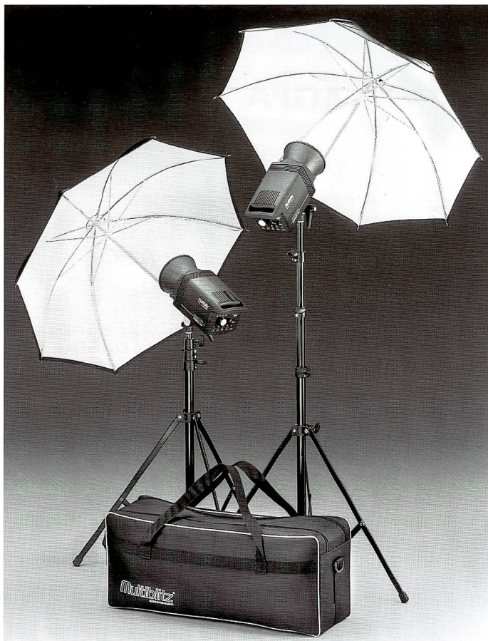
Profilite 200 Compact Set stellt mit zwei Geräten in Komplett-Ausstattung die ideale Lichtausrüstung für den Fotografen unterwegs dar.

das bedeutet Blende 22 mit dem Normalreflektor aus 2 m Abstand bei einer Filmempfindlichkeit von ISO 100. Hinzu kommt die stufenlose Energieregulierung über vier Blendenstufen bei proportionalem, hellem Halogeneinstlicht. Natürlich können die farbneutrale, UV-gesperr-