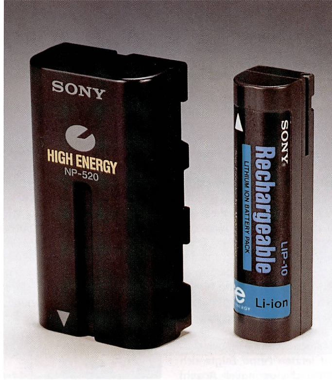
An neuen Energieträgern für Kleingeräte wird kräftig geforscht. Vor allem in die Lithium-Ion Akkus setzt man grosse Hoffnungen.

Wiederaufladbare Batterien werden in der Regel nach Mass gefertigt und direkt an die Endhersteller geliefert. So bestehen zwischen Herstellerfirma und Abnehmermarke langjährige Geschäftsbe-