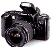
Canon EOS 500

So ein Kunststück könnte Ihnen auch gelingen. Keine andere Spiegelreflexkamera macht es Ihnen so leicht wie die EOS 500 von Canon. Sie stellen am übersichtlichen Einstellrad einfach das entsprechende Programm ein (Nahaufnahme für Frösche, Porträt für Prinzen, Sport für Weitspringer usw.), und Spitzentechnik hilft Ihnen von der ersten Minute an auf die Sprünge.