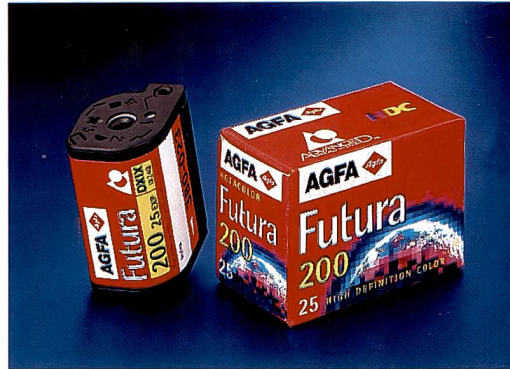
Futura 200: Jetzt ist die Reihe der Agfa Futura-Filme für die APS-Kameras komplett.

System durchsetzen. Deshalb kann es jetzt nicht mehr darum gehen, weiterhin den wenig überzeugenden Start zu beklagen, vielmehr kann für die Branche die Parole nur lauten: Nutzen wir die Chance, die uns dieses System in bezug auf den technischen Fortschritt und auch als zusätzlicher Wachstumsträger bietet.