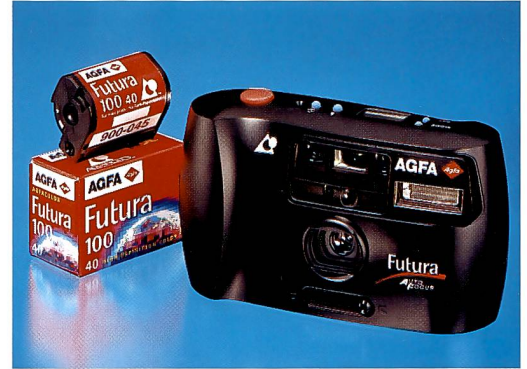
Agfa steigt wieder ins Kamerageschäft ein und präsentierte an der photokina zwei APS-Kameras.

vor allem verbesserte Schärfe und Körnigkeit aufweisen. Deshalb ist die Gesamtschichtdicke der Emulsionen signifikant reduziert worden. Dies vermindert die Lichtstreuung im Film während der Belichtung und ist die Basis für eine Schärfeerhöhung. Neue Emulsionen, die aus flachen, oberflächen-aktivierten und mehrschichtstrukturierten Kristallen,