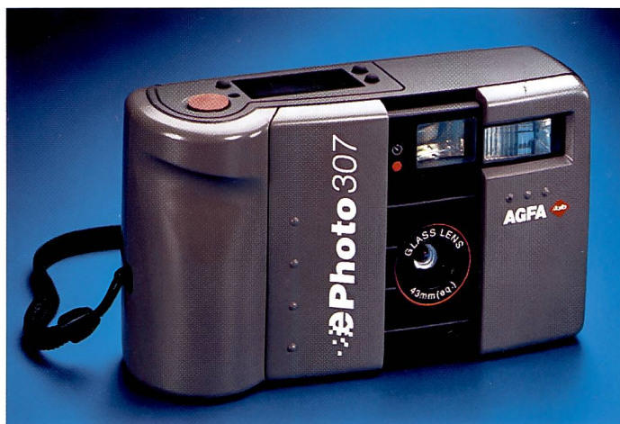
Klare Bekennung zur digitalen Fotografie. Die Reihe der Action- und StudioCam-Kameras wird mit dem Amateurmodell ePhoto 307 ergänzt.

Bereich Equipment/Elektronik. Im Scanner-Markt, wo unsere Produktpalette vom kleinen DTP-Scanner bis zum Highend-Gerät für 60'000 DM reicht, sind wir der grösste Anbieter unter den Fotounternehmen, im Weltmarkt insgesamt die Nummer Drei.