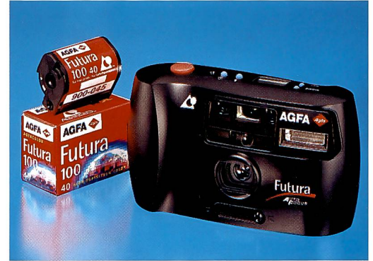
Agfa steigt wieder ins Kamerageschäft ein und präsentierte an der photokina zwei APS-Kameras.

vor allem verbesserte Schärfe und Körnigkeit aufweisen. Deshalb ist die Gesamtschichtdicke der Emulsionen signifikant reduziert worden. Dies vermindert die Lichtstreuung im Film während der Belichtung und ist die Basis für eine Schärfeerhöhung. Neue Emulsionen, die aus flachen, oberflächen-aktivierten und mehrschichtstrukturierten Kristallen,