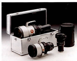
Apo-Telyt-Modul-System: für 280, 400, 560 und 800 mm