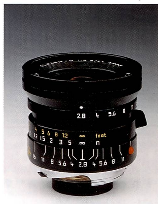
Weitwinkel in Höchstform: Elmarit-M 1:2,8/24 mm ASPH.