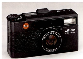
Die Leica minilux gibt es jetzt auch in Schwarz