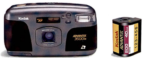
Kodak Advantix Kameras und Filme