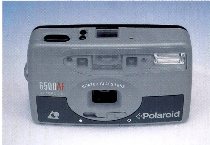
Die beiden APS-Modelle von Polaroid präsentieren sich in einem modernen Design und werden in einem Set mit Tasche, Batterie und Film verkauft.

Die Polaroid 6500 besitzt ein Zweizonen-Autofokus. Die Nahaufnahmegrenze liegt für die Polaroid 6500 bei 90 cm, für die 5500 bei 1,2 m. Die von