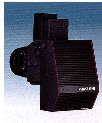
Für den Einsatz im Studio stehen heute die unterschiedlichsten Produkte zur Verfügung. Für einen Kaufentscheid müssen verschiedene Fragen abgeklärt werden, beispielsweise, ob eine Komplettlösung angeschafft oder ob ein Rückteil verwendet werden soll, das mit einer bereits bestehenden Kamera-Ausrüstung zum Einsatz kommt.