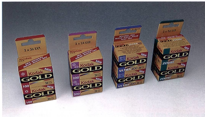
Die Packungen der neuen Kodak Gold-Linie zeigen ausser Filmbezeichnung und ISO-Zahl Piktogramme für den optimalen Praxiseinsatz.

Als weiterer Fortschritt kontrollieren neue dynamisch