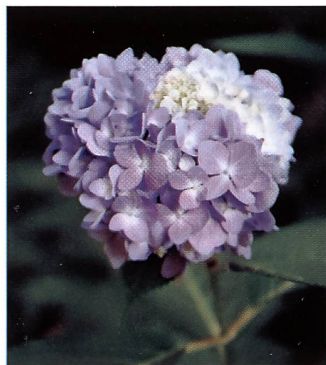
Links der bisherige Gold 200, rechts der neue Gold 200. Das Blau der Hortensienblüte wird vom neuen Film korrekt wiedergegeben.

Die Verwendung von spezifischen Stabilisatoren und andere technologische Massnahmen verhindern auch Farbverschiebungen, die durch hohe Temperaturen oder hohe