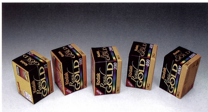
So präsentiert sich die neue Filmreihe Royal Gold, die neuen Farbnegativfilme für höchste Ansprüche mit APS-Filmtechnologie.

che im Kodak Sortiment die berühmten Ektar Filme ersetzt – gibt es in den Empfindlichkeiten ISO 25, 100, 200, 400 und 1000, vom superscharfen 25er für starke