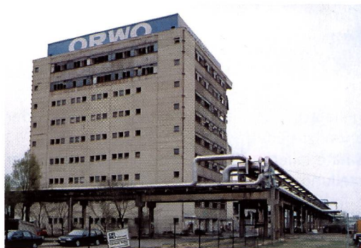
Die alte Orwo weicht einem neuen Industriezentrum

seiner Art, denn in keinem anderen Fotomuseum oder Filmwerk der Welt ist eine vollständige Produktionsanlage für Fotomaterial der Öffentlichkeit zugänglich. Noch etwas Positives gibt es aus Wolfen zu berichten: Der