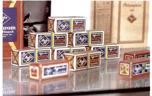
Agfacolor-Filmverpackungen um 1950

gegenwärtig ein Grosslabor eingerichtet, das auf die Produktion von 50 bis 60 Millionen Farbbildern pro Jahr ausgelegt ist. Weiter ist die Produktion von Rohfilm