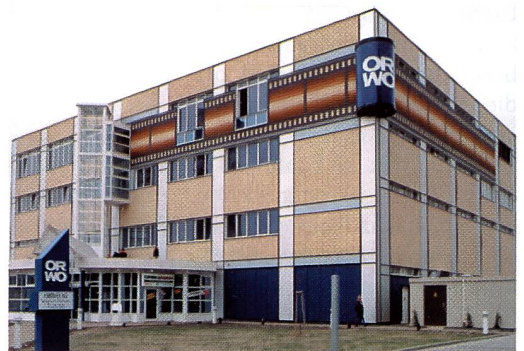
Die neue Orwo baut ihre Marke wieder auf

Geschäftsführer der neuen Orwo eingesetzt. Nun wird in renovierten Räumlichkeiten OEM-Filmmaterial konfektioniert und über die bisherigen, bewährten Vertriebskanäle unter der bisherigen Marke Orwo abgesetzt. Zudem wird