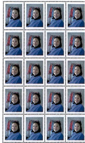
Der Standard-Briefmarkenbogen ab jeder Vorlage mit 40 persönlichen Postgrüssen kostet im Fotofachgeschäft nur 30 Franken