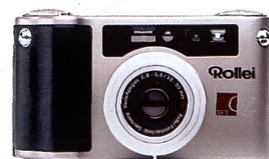
Ausrichtung auf eine neue Zielgruppe mit den QZ-35-Modellen

le Kunden in jeder Hinsicht äusserst attraktiv ist. Kerngeschäft von Rolleil – und weiterhin ein breites Entwicklungsfeld neuer Produkte – stellt der Bereich der Mittelformatkameras dar, wo sich Rolleil unüberhörbar vorgenommen hat, seine Marktführerrolle weiter auszubauen. Damit deckt Rolleil nicht nur einen grossen Bedarf im pro-