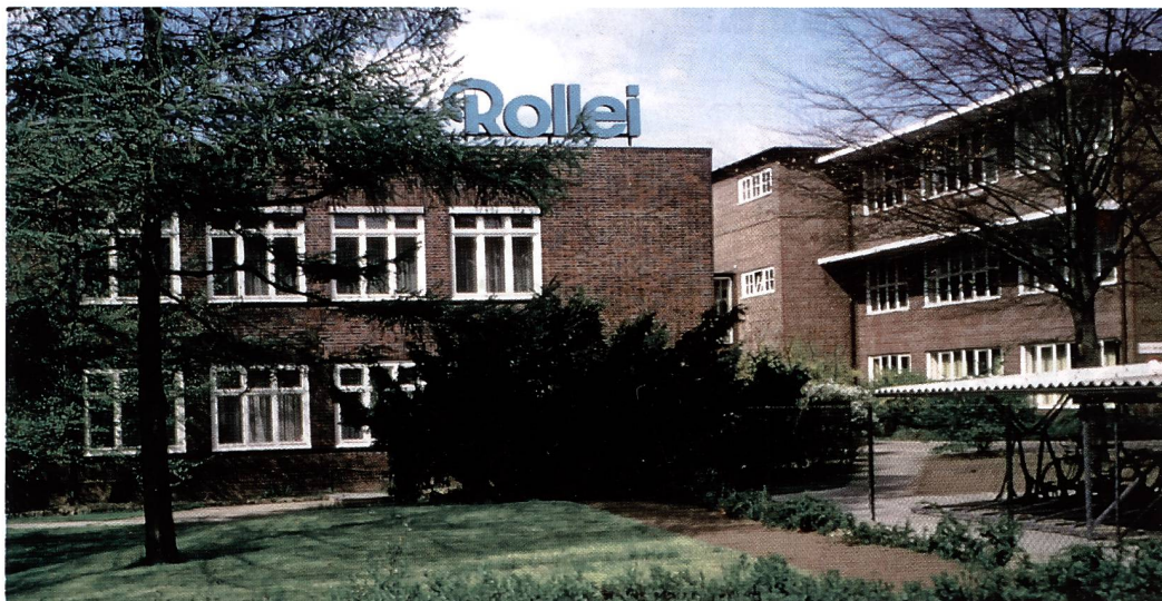
Im Hauptsitz von Rolleil in Braunschweig ist seit einem Jahr das RolleilSamsung F+E-Zentrum untergebracht