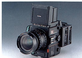
Professionelle Mittelformatkameras bleiben das Kerngeschäft

des Unternehmens vorgibt und es hervorragend versteht, seine Mitarbeiter zu motivieren. Man ist zu Recht stolz auf das «Made in Germany» und die soeben erworbene Zertifizierung ISO 9001.