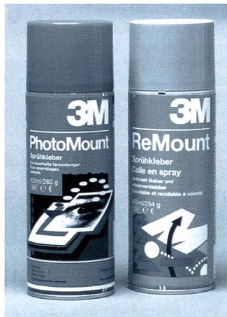
Sprühklebstoffe PhotoMount – für exaktes Montieren

Der Scotch PhotoMount Spray ist für dauerhaftes Aufziehen für Fotos konzipiert, wobei sich die Position der Bilder auf der Unterlage noch während fünf Minuten korrigieren lässt. Erst danach ist ein Ablösen nicht mehr möglich. Der Scotch DisplayMount ist geeignet, um Dekorteile, Schilder, Textilien, Schaumstoff, Styropor etc. auf irgendwelchen Flächen zu befestigen. Er ist im Studio ein wertvoller Helfer und wird bei der Herstellung von Werbematerialien häufig eingesetzt. Der Scotch SprayMount ist der am häufigsten benutzte