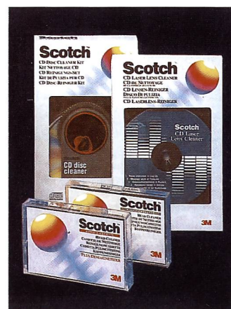
Unverzichtbar: Scotch Reinigungskassetten für alle Audio- und CD-Player