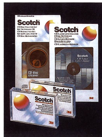
Unverzichtbar: Scotch Reinigungskassetten für alle Audio- und CD-Player