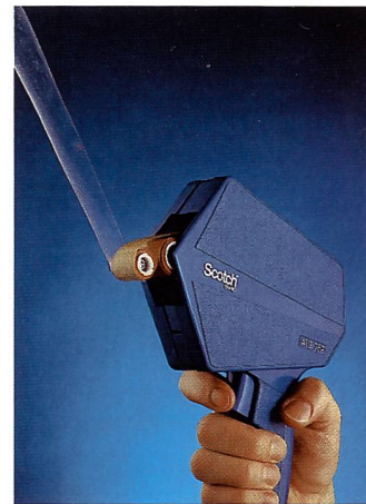
Scotch ATG – der praktische Klebstoff von der Rolle

Doppelseitiges Klebband ist für Fotografen ein enorm wichtiges Hilfsmittel, sei es bei der Aufnahme zum Improvisieren von Aufbauten