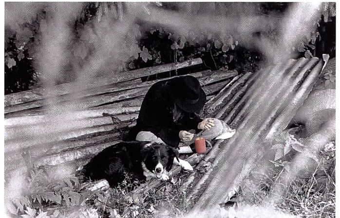
«Hände weg! – Drogen» von Susanne Nüesch

Zum zweiten Mal wurde dieses Jahr unter den Mitgliedern der Interphot' ein Porträtwettbewerb für Lehrlinge ausgeschrieben. Zum Thema «In & Out» mussten zwei Bilder eingereicht werden. Wie das Thema interpretiert wurde, war der eigenen Fantasie überlassen. Ziel der Porträtwettbewerbe von Interphot' ist es, die Lehrlinge anzuregen, sich mit einem vorgegebenen Thema zu befassen und dieses fotografisch umzusetzen. Dass dabei auch noch attraktive Preise zu gewinnen sind, ist natürlich ein willkommener Nebeneffekt. Aber, gute Leistungen sollen auch belohnt werden. Erstaunlich ist, dass auch diesmal der Wettbewerb wiederum von weiblichen Lehrlingen gewonnen wurde. Sind es