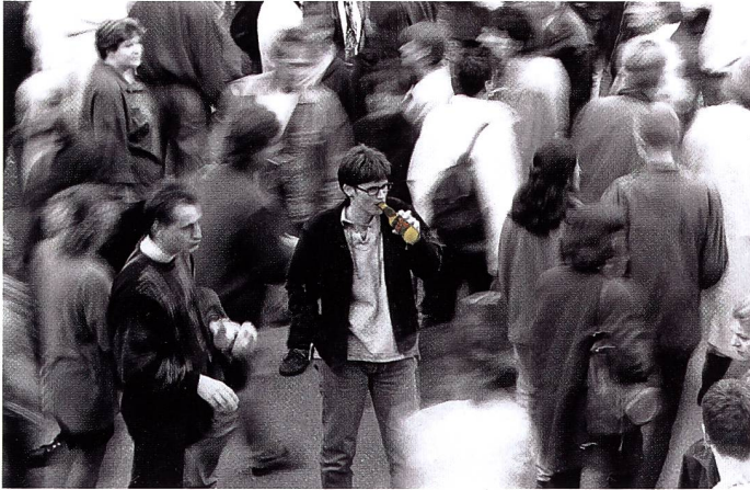
«Es leben Energiedrinks! – Hooch» von Susanne Nüesch