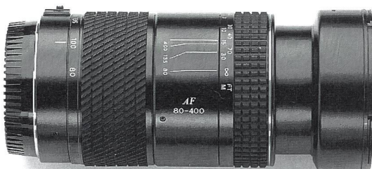
Tokina AT-X AF 4,5-5,6/80-400 mm

Ob Sie mit Canon, Minolta, Nikon oder Pentax AF fotografieren, mit dem ersten 80-400-mm-Zoom der Welt kommen Sie schneller näher ran. In einem strapazierfähigen Metallgehäuse von nur 13,6 Zentimeter Baulänge bietet dieses Fünffachzoom eine profitaugliche Hochleistungsoptik zu einem auch für Amateure attraktiven Preis: Fr. 1380.–.