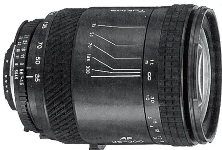
Tokina AF 4,5-6,7/35-300 mm

Ob Sie mit Canon, Minolta, Nikon oder Pentax AF fotografieren, mit dem neuen 35-300-mm-Zoom von Tokina haben Sie die Situation schneller im Griff. In einem strapazierfähigen Metallgehäuse von nur 10,1 Zentimeter Länge bietet dieses besonders vielseitige Objektiv eine profitaugliche Hochleistungsoptik zu einem auch für Amateure attraktiven Preis: Fr. 760.-