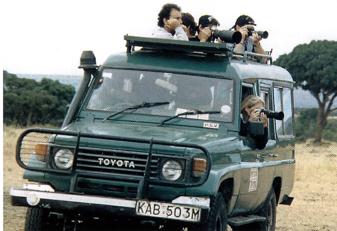
Kenia – eine Welt voller Motive! Was man sonst nur aus Büchern kennt, lief nun – in sicherer Distanz – frei vor der Linse herum

Auf die Analyse der verschiedenen Konsumentenverhalten folgte die Faszination der sehr reichen Fauna und Flora