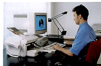
Ob Pultstation oder elegantes Notebook spielt keine Rolle. Mit beidem kann man über ein Modem ins Internet.

Was auf der Rechenkiste draufsteht, ist aus Internetsicht ziemlich egal. Und was drin steckt, eigentlich auch. Falls moderne Programmpakete Sie nicht schon längst zum Aufrüsten gezwungen haben, finden Sie selbst für einen 486er PC mit Windows