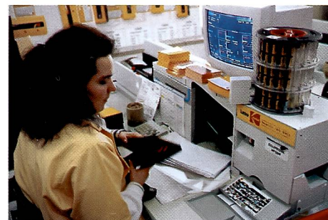
Verrechnungsstation mit Endkontrolle des Auftrages und Zusammenführen von APS-Film, Filmkassette, Indexsprint und Bilder.

stab verändert, während zwei Formatmasken das Bildfeld begrenzen. Und das Ganze passiert natürlich ohne Papierverlust bei einer Stundenkapazität von 16'000 Bildern. Das ergibt einen theoretischen Wert von 4,5 Kopien pro Sekunde, der in der Praxis etwa bei 3,9 liegen dürfte.