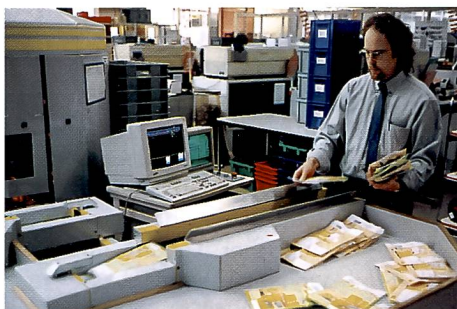
Fehler sind praktisch ausgeschlossen: Automatisches Einlesen der Filmtaschen und Sortieren nach Filmart und gewünschter Bildgrösse.

so wird die Auftrags tasche von der automatischen Laufbahn heraussortiert und manuell dem richtigen Verarbeitungskanal zugewiesen. Stellt die Filmprüfung vor der Entwicklung beispielsweise eine angerissene Perforation