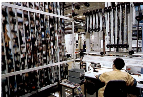
Rundum Bilder! Am Kontrolltisch wird jedes Bild visuell inspiziert. Geübte Augen geben hier eventuelle Korrekturwerte ein.