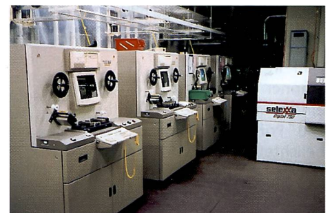
Die entwickelten Negative werden mit einem Scanner erfasst, um die Korrekturdaten zu berechnen und Indexprints herzustellen.

engagiert, damit auch dann die kurzen Lieferfristen eingehalten werden können. Dass Kodak Photo Service SA, Renens, nicht nur für den Fotofachhandel arbeitet, ist bei dieser Betriebsgrösse logisch. «Ausser dem Fotofachhandel sind neun Migros-Genossenschaften ein wichtiger Umsatzträger wie, in