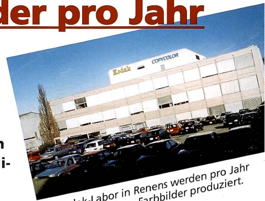
Im Kodak-Labor in Renens werden pro Jahr über 150 Millionen Farbbilder produziert.

den letzten Jahren stetig zurückgegangen, so dass ein Grosslabor völlig ausreicht, um den Weltbedarf beinahe abzudecken. Gesamtvolumen: rund zwei Millionen Filme pro Jahr. Die Filme sind längstens zwei Tage im Labor und treten dann ihre oft lange Rückreise wieder an. Die Zahlen qualifizieren das Labor in Renens nicht nur quantitativ als grösstes Kodak-Labor Europas, son-