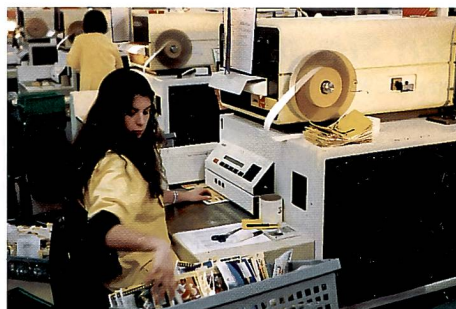
Jeweils 250 Filme werden zu grossen Rollen aneinandergespleist, bevor sie zur Entwicklung und in die Bildproduktion gelangen.