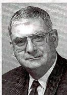
Hans Peyer Präsident des SVPG

Kürzlich hatte ich ein Telefongespräch mit einer Lehrtochter, deren Ausbildungszeit als Fotofach-Angestellte mehr als zur Hälfte vorbei ist. Sie sorgt sich, im Fach Verkauf zu wenig gut ausgebildet zu sein. In ihrem Lehrbetrieb sind praktisch keinerlei Kameras oder Geräte und Zubehöre dazu vorhanden. Am Ladentisch werden die im eigenen Mini-lab gemachten Bilder ausgeliefert, deren Weiterbearbeitung (Vergrösserungen, Aufziehen, Einrahmen usw.) angeboten oder das Material für deren Präsentation wie Rahmen, Alben usw. verkauft. Daneben werden in diesem Betrieb als