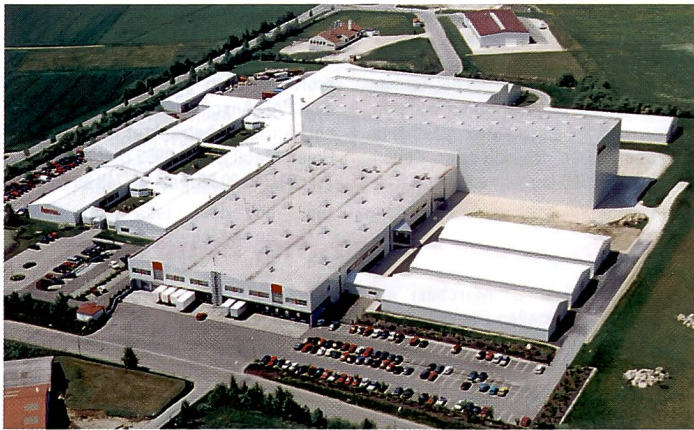
Hama heute: Zum 75jährigen Jubiläum wurden ein Hochregallager mit 40'000 Palettenplätzen und ein Logistikzentrum in Betrieb genommen.

zeitig 500 Kartons mit einem Gewicht bis zu 50 kg versandfertig gemacht. Lückenlosen Nachschub gewährleistet das vollautomatische, 25 m hohe Hochraumlager. Insgesamt 40'000 Palettstellplätze stehen für das breite Programm von heute zirka 14'000 Produkten zur Verfügung. Heute beschäftigt Hama 1'200 Mitarbeiter in Europa, davon 870 in Monheim. Das Unternehmen liefert an Exklusivpartner in 110 Ländern der Welt, mit einem Löwenanteil von 80 Prozent in Europa, wo derzeit acht