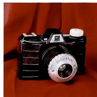
1953 – Hama stellt Kameras für Rollfilm 120 aus Bakelit her.

Anfang der 80er Jahre kommt der nahtlose Übergang vom Schmalfilm in den Video-Sektor, worauf Hamaphot mit der Herstellung und Vermarktung von Audio- und Videozubehör im UE-Handel neue Geschäftspartner findet.