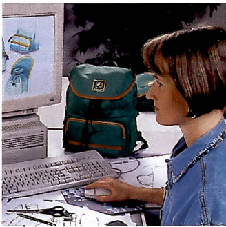
Neue Produkte kommen aus der eigenen Entwicklungsabteilung.