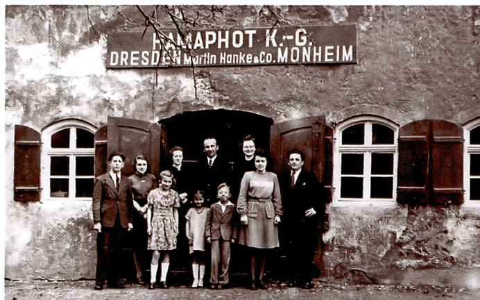
Neuanfang nach dem zweiten Weltkrieg in Monheim: Hamaphot spezialisiert sich auf den Zubehörhandel für's aufstrebende Fotohobby.

1993 legen die Produktlinien Bilderrahmen und Alben kräf-