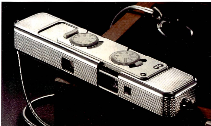
Zum 60jährigen Jubiläum der legendären Kleinstbildkamera erscheint ein neues Kameramodell, die Minox CLX.

(C=Chrom). Besonders interessant jedoch ist die Verarbeitung des Messinggehäuses selbst, bei der in einem sehr aufwendigen handwerklichen Verfahren, Gouillochierung genannt, eine ebenso edle wie unverwechselbare Oberflächenstruktur entsteht. Die neue Minox CLX ist mit einem vierlinsigen Objektiv 1:3,5/15 mm mit