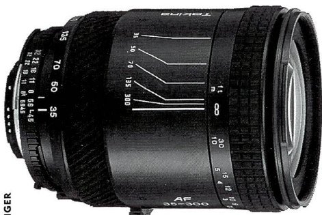
Tokina AF 4,5-6,7/35-300 mm

Ob Sie mit Canon, Minolta, Nikon oder Pentax AF fotografieren, mit dem neuen 35-300-mm-Zoom von Tokina haben Sie die Situation schneller im Griff. In einem strapazierfähigen Metallgehäuse von nur 10,1 Zentimeter Länge bietet dieses besonders vielseitige Objektiv eine profitaugliche Hochleistungsoptik zu einem auch für Amateure attraktiven Preis: Fr. 698.-.