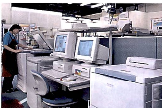
Geräte für jede Art der Bildbearbeitung und Bildausgabe.