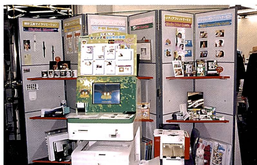
Für schnelle Visiten- und Glückwunschkarten gibt es eine menügeführte Selbstbedienungsstation.