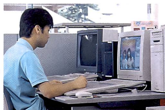
Professionelle Gestalter erfüllen jeden Kundenwunsch.