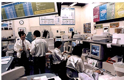
Auf engem Raum betreiben 27 Angestellte jede Art von Bildgestaltung für ausgefallene Produkte.