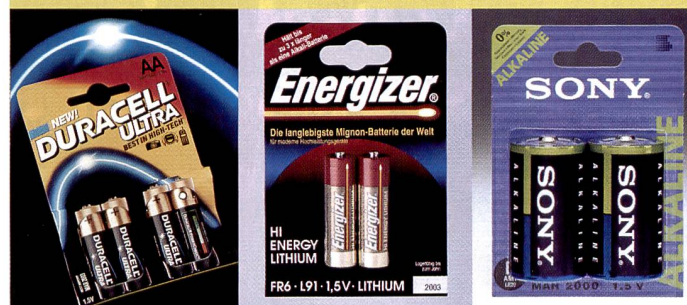
Kraft aus der Blisterpackung: Das Angebot präsentiert sich vielfältig.

rungen bei den Anoden- und Kathodenmaterialien und der Leitfähigkeit, d.h. Absenkung des Innenwiderstandes. Dass der Innenwiderstand ( R_i ) für alle Hersteller zum Thema wurde, ist natürlich kein Zufall, denn dieser bedeutet einen internen Verlust. Ist R_i klein, können höhere Ströme ohne Absinken der Klemmenspannung abgegeben werden. Das heisst, die Batterie kann kurzzeitig mehr Leistung abgeben. Philips bietet für unterschiedliche Anwendungen zielgerichtet zwei Alkaline-Batteriemodelle an. Für hohe Leistung ist die giffreie «PowerLife» (Typ Zink-Mangan) ausgelegt und verspricht dank konsequenter Ausnutzung modernster Graphit-Technologie mehr Strom und längere Lebensdauer, während für anspruchlosere Energieverbraucher wie Wanduhren, Taschenrechner, Fernbedienungen die «Long-Life-Batterien» (Typ Zink-Chlorid) geeignet sind, und dafür exzellente Eigenschaften wie lange Lebensdauer (tiefe Entladeschluss-Spannung) und grosse Auslaufsicherheit aufweisen: Die verbrauchte Batterie ist innen trocken, die Gefahr der Korrosion daher sehr gering.