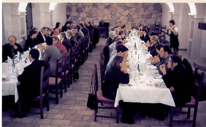
Im romantischen Kellergewölbe des Hotel Hirschen fand das traditionelle Festbankett statt.