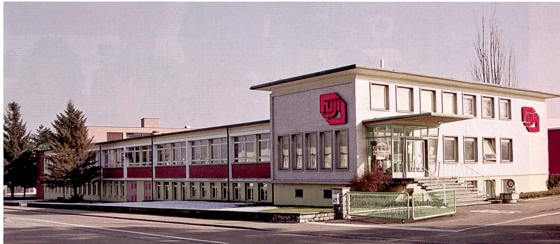
Das Fujilabor in Dielsdorf wird nach der Übernahme von Colorlabor zum drittgrössten Labor der Schweiz.

Wir rechnen im Endausbau mit einem Personalbestand von etwa 90 Personen. Der Vertrag tritt ab 1. April in Kraft, und wir rechnen, dass wir Mitte Juni voll in Produktion gehen können.