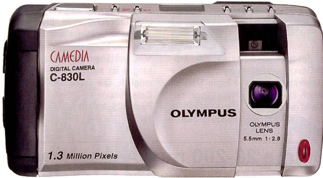
Preisgünstige Digitalkamera mit 1,3 Mio. Pixeln: Olympus C-830L

Neben der PMA-Überraschung C-2000 Zoom bringt Olympus die Digitalkamera C-830L, sechs Kleinbild- und APS-Kameras und diverses Zubehör.