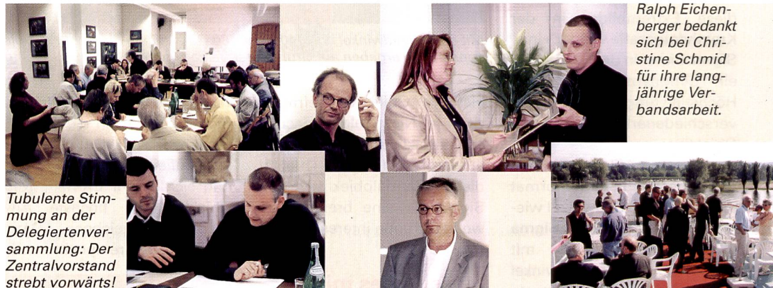
Tubulente Stimmung an der Delegiertenversammlung: Der Zentralvorstand strebt vorwärts!