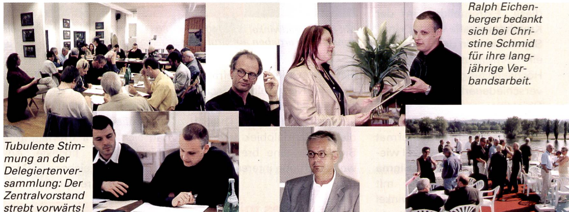
Turbulente Stimmung an der Delegiertenversammlung: Der Zentralvorstand strebt vorwärts!