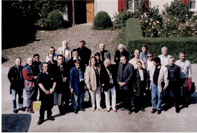
Die SBf-Delegierten und Gäste vor dem Seemuseum in Kreuzlingen.