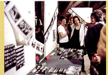
Das Bad Pfäfers bei Bad Ragaz war ein gediegener Rahmen für die erste Ostschweizer Diplomfeier der Fotofachangestellten.

nur wenige – Gelegenheit, die Prüfungsarbeiten zu besichtigen, die im geräumigen Dachstock mit viel Mühe ausgestellt wurden. Danach erfolgte das eigentliche Zeremoniell der Diplomübergabe an die 16 jungen Fachkräfte, die nach der dreijährigen Lehrzeit die Prüfung bestanden und einen kräftigen Applaus verdient hatten. Ein kleiner Imbiss rundete den gemütlichen Tag ab, der den jungen Absolventinnen und Absolventen noch lange und auf angenehmste Weise in Erinnerung bleiben dürfte.