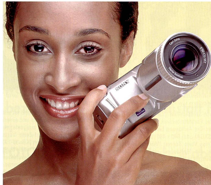
Mit der neuen DSCF505 setzt Sony gänzlich auf MemoryStick.

Die IFA in Berlin (28.8. bis 5.9.) und die Orbit in Basel (21. bis 25. 9.) bewegen die digitale Szene. Neben den unüberschaubaren Neuheiten der Unterhaltungselektronik gibt es auch einiges Interessantes im Foto- und Videobereich.