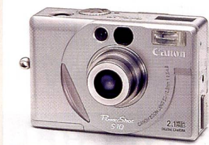
Canon PowerShot S10

Das günstigere Modell GR-DVL20 ist mit einem Schwarzweiss-Sucher, einem 2,5-Zoll-TFT-LC-Display ausgestattet und kostet 1599 Franken. Die 200 Franken teurere GR-DVL30 verfügt