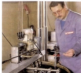
Elektrolytische Silberückgewinnung aus Fixierbädern.

Die Verordnung über den Verkehr mit Sonderabfällen (VVS) erklärt bestimmte Abfallstoffe zu Sonderabfällen. Gemäss dieser Verordnung dürfen nur Entsorger mit Empfängerbewilligung – über die Rethmann Suisse vollumfänglich verfügt – solche Stoffe entgegen-