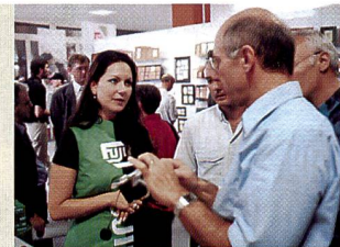
Ideale Gelegenheit, um Fachfragen zu diskutieren.