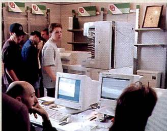
Star des Tages: Digitales Minilab Frontier 350