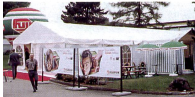
Gastronomie und Unterhaltung im Zelt.

läuft, wie wir dies gerne hätten ... Es hat sich aber schon jetzt gezeigt, dass sich diese Investition gelohnt hatte. Sie hat sogar einen patriotischen Aspekt, wenn Sie so wollen, denn hätten wir Jodendstorf nicht gekauft, so hätte es CeWe getan, und dann wäre ein weiterer beträchtlicher Teil des Schweizer Bildergeschäftes ins Ausland abgewandert.»