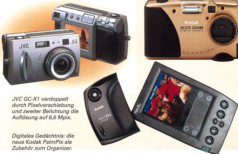
JVC GC-X1 verdoppelt durch Pixelverschiebung und zweiter Belichtung die Auflösung auf 6,6 Mpix.

Die neue Schnappschuss-Digitalkamera Kodak DC215 Gold Zoom fällt durch ihr goldenes Metallgehäuse auf. Ein standardmässig beigelegter USB Card-Reader sowie ein verringerter Stromverbrauch sind weitere Pluspunkte. Sie zeichnet sich zudem durch eine Bildauflösung von 1152 x 864 Pixel, dem Zweifach-Weitwinkel Zoomobjektiv aus, das den mit Kleinbild vergleichbaren Brennweitenbereich von 29 bis 58 mm abdeckt. Auf