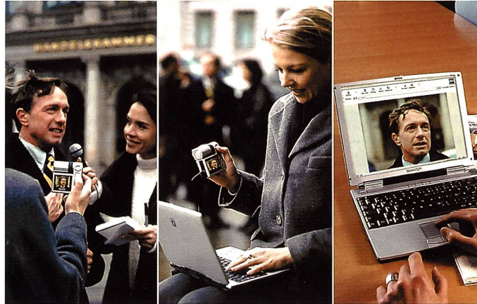
Die Sharp ViewCam VN-EZ5 ist für Journalisten konzipiert: Die Daten können sofort übers Internet in die Redaktion geschickt werden.

MB-Smartmedia-Card können bis zu 120 Minuten Videoaufzeichnung mit Ton oder maximal 1152 Standbilder gespeichert werden. Anschliessend lassen sich die digitalen Daten