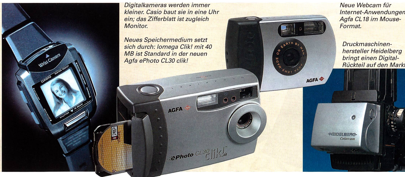
Digitalkameras werden immer kleiner. Casio baut sie in eine Uhr ein; das Zifferblatt ist zugleich Monitor.

endlich. Mit dieser Minikamera können Schwarzweiss-Bilder in 16 Graustufen automatisch abgespeichert werden. Zusätzlich können persönliche Daten zu den Bildern aufgenommen werden. Der Datenspeicher reicht für bis zu 100 Fotos. Bei Erreichen der maximalen Speicherkapazität können die Aufnahmen per Infrarot auf den PC übertragen und dort archiviert werden. Der Merge-Modus ermöglicht die Montage zweier