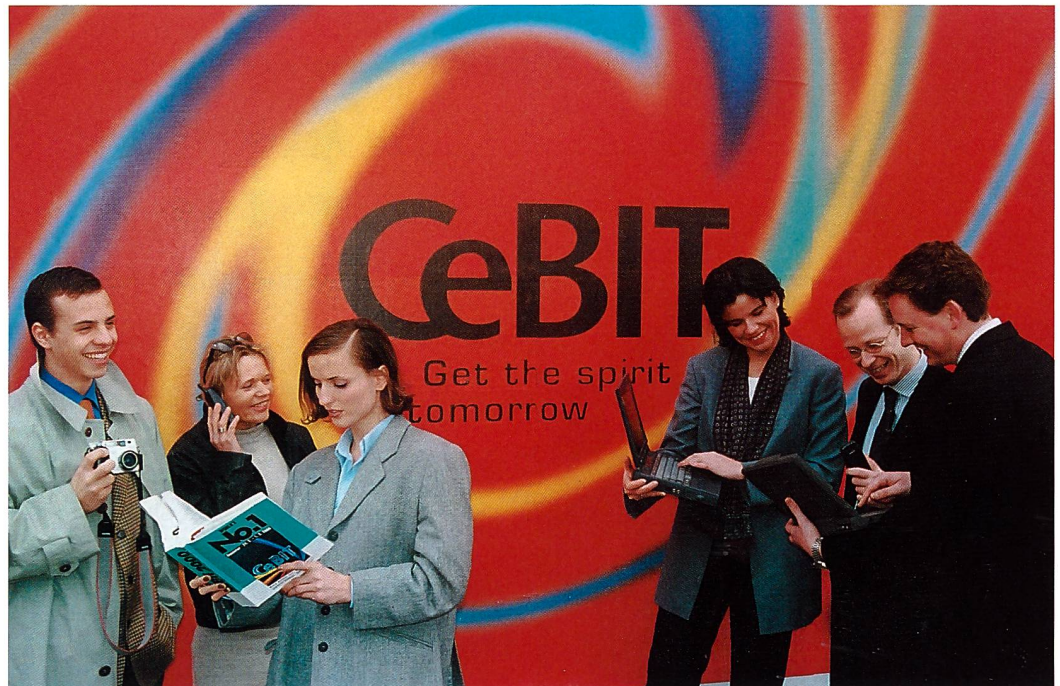
Rund 750'000 Besucher auf der diesjährigen CeBIT! Da sage einer, er hätte alles gesehen ...

Wer Bilder für Album benötigt oder verschenken will, nutzt