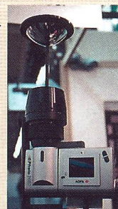
Powell eVision: Digitalkamera für Panorama-Aufnahmen.