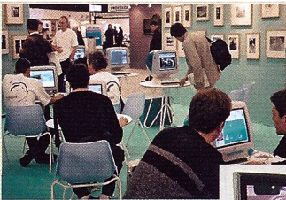
Digitale und analoge Bildpräsentationen begegnen sich.

Für kleinere Budgets dürfte die Pentax MX-30 ein sehr beliebtes Modell werden. Die beleuchteten Symbolanzeigen – wie bei der MX-7 – faszinieren, und die Kamera bietet ein ausgezeichnetes Preis-/Leistungsverhältnis. Besonders im preisbewussten französischen Markt dürfte sie ein Renner werden.