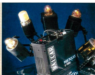
Am Balcar Nexus-Generator können alle Lampenköpfe angeschlossen werden.

• Das digitale Minilab von KIS/Photo-Me aus heimischer Produktion ist eines der günstigsten des Marktes. Es können Kleinbild-, APS- und 120er-Filme verarbeitet sowie Diapositive und Aufsichtsvorlagen eingescannt werden.