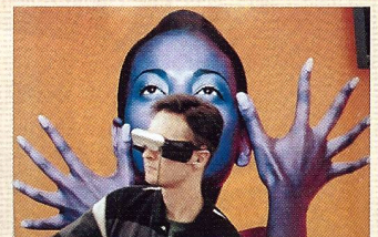
Bilderlebnis im Cyberworld-Zeitalter: Olympus Eye-Trek fasziniert die Besucher.

sprach mit FOTOintern. «Die Filmhersteller und viele Aussteller rein professioneller Produkte hätten weiterhin eine reine Fachmesse vorgezogen». Gefördert wurde die Öffnung der Messe auch durch eine Gutscheinkampagne in allen wichtigen Fotozeitschriften Frankreichs, die ihre Leser mit vergünstigten Eintritten lockten.