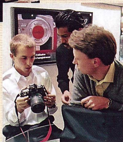
Heiss umringt: Die digitale Spiegelreflex von Fujifilm.