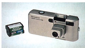
Fuji Nexia 2000ix

• Kodak demonstrierte den neuen Personal Picture Maker Kit. Dieser besteht aus der Digitalkamera DC215 Zoom und einem neuen gemeinsam