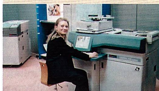
Das Digital-Minilab von KIS ist preisgünstig und leistungsfähig.

mit Lexmark entwickelten Tintenstrahldrucker, der die Daten ohne dazwischen geschalteten PC ausdruckt.