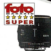
50 mm F2,8 MACRO EX