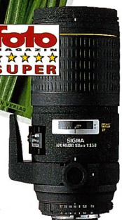
180 mm F3,5 MACRO EX IF HSM