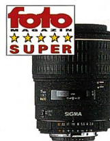
105 mm F2,8 MACRO EX