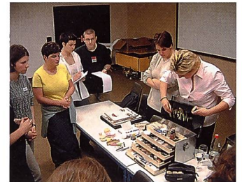
Stimmungsbilder aus den drei Workshops, die anschliessend an die Generalversammlung des ypp bei Pro Ciné in Wädenswil stattfanden.

etwas über Trends und neue Arbeitstechniken sagt – oder sagen kann – dann entsteht bei den Lehrlingen entweder ein enormer Nachholbedarf, oder sie verlieren die Lust an ihrem Beruf. Und genau da haken wir ein. Wir bieten diesen Jungen Workshops und Seminare, die sonst kaum wo zu finden sind.